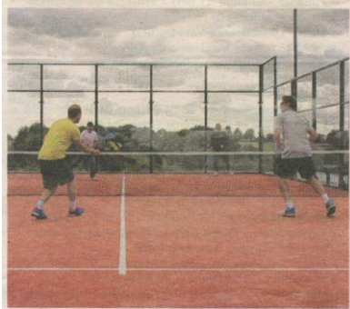
Les deux tournois de double auront lieu sur trois jours.

Le Tennis club de Châteaubriant (TCC) va organiser deux tournois de padel, du vendredi 21 au dimanche 23 septembre. Ils auront lieu sur le terrain de padel du club, à la halle de tennis de Renac de Châteaubriant.