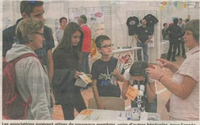
Les associations espèrent attirer de nouveaux membres, voire d'autres bénévoles, pour l'année en cours.

Plus de 100 associations sportives, culturelles et caritatives seront présentes pour l'occasion. Comme chaque année, les Châteaubriantais pourront profiter du forum des associations pour découvrir un large éventail d'activités proposées par les associations locales. Cet événement permet au public d'obtenir toutes les informations nécessaires pour pratiquer la ou les disciplines de leur choix ou intégrer un club, dans les domaines du sport, de la culture, ou de l'action caritative.